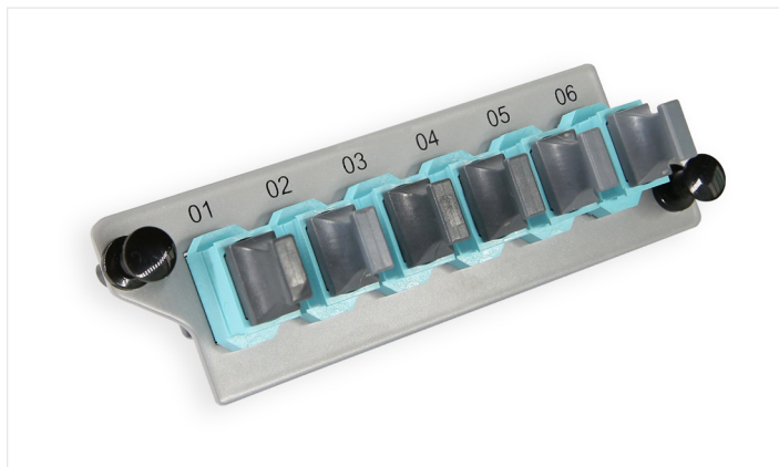
MCH MPO 面板, 6 口

MCH 面板提供了主干光缆和主干光缆，主干光缆和分支跳线的互联，可选择 4口或 6口的 MPO 面板以及12芯和 24芯的 LC 面板。