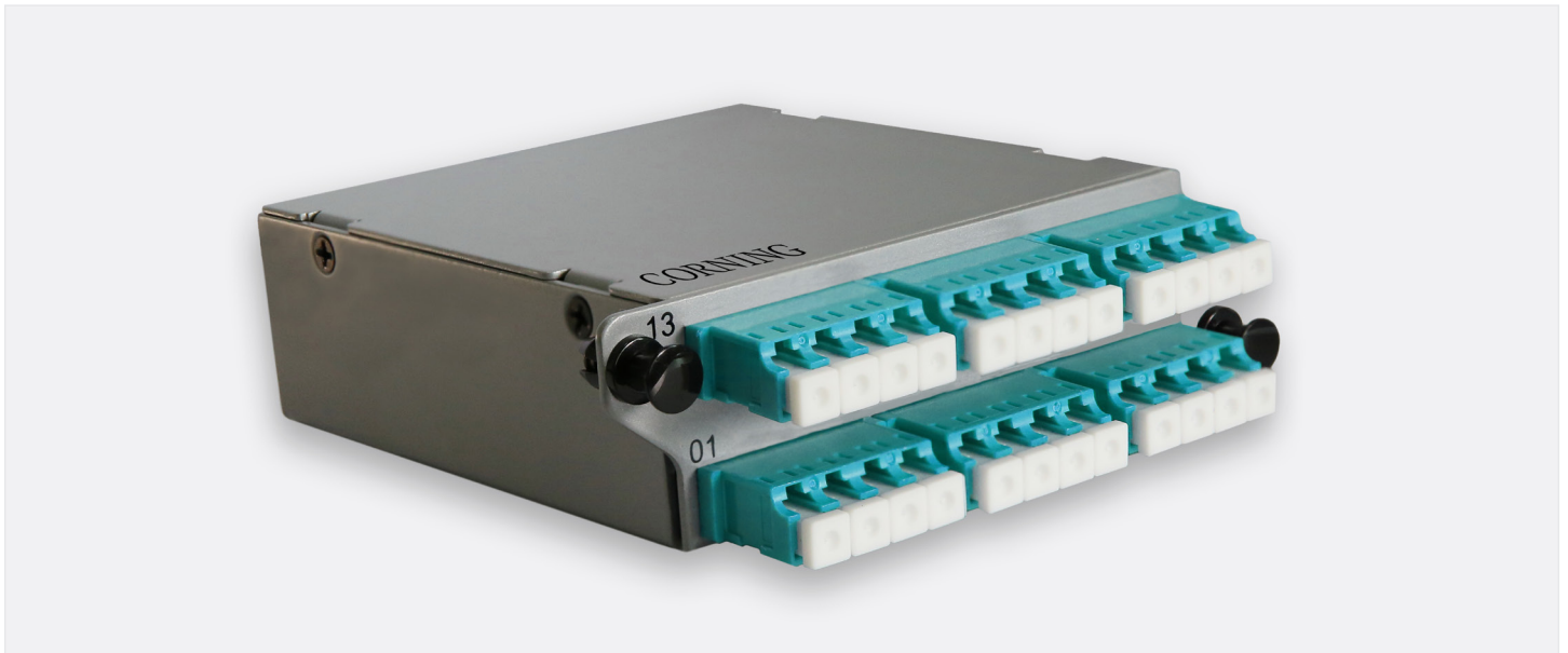
MCH 模块, 24 芯

MCH 模块提供 MPO 主干光缆和 LC 双芯跳线的转换，通过 MCH 模块可以方便地转换成 LC 接口连接有源设备。配置有 1 个 MPO 到 12 芯 LC 模块，2 个 MPO (基于 12 芯) 到 24 芯 LC 模块，以及 3 个 MPO (基于 8 芯) 到 24 芯 LC 模块