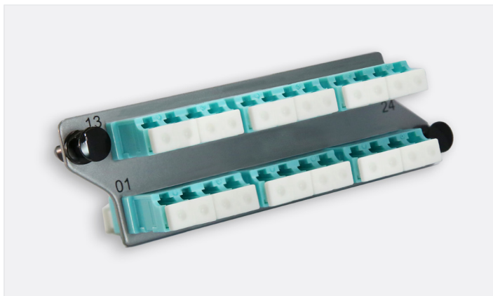
MCH LC 面板, 24 芯