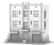
Kleine u. mittlere Gebäude

Corning® Everon® Netzwerklösungen vereinen kabelgebundene und kabellose Konnektivität in einem einzigen erweiterbaren Netz.